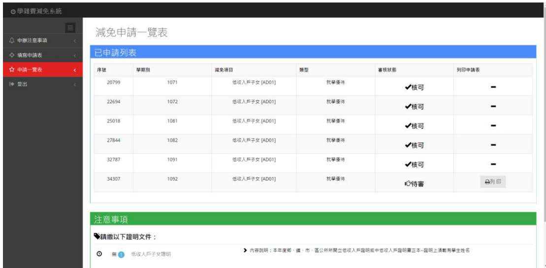
圖 5、減免申請一覽表